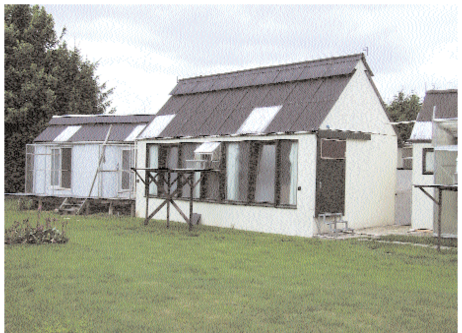
Die Schläge der erfolgreichen Witwer, einfach und zweckmäßig und mit einer optimalen Be- und Entlüftung ausgestattet.

Ausnahmeschlag in unserer Zeitschrift einmal vorzustellen. Gedacht – getan: Kurz per E-Mail Kontakt aufgenommen und einen Termin vereinbart. Lesen Sie selbst, was dabei herausgekommen ist: