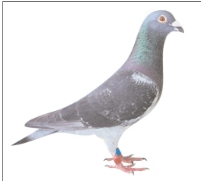
Der „Bosco“ vertritt die dunkle Vercammen-Basis. Er wird u. a. in 2004 1. nat. Ass-Taube Mittelstrecke Belgische Duivensport.