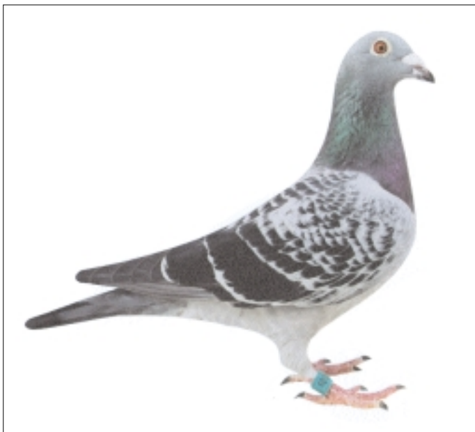
„Beauty“, 2. nat. Argenton (555 km) gegen 21299 Tauben, Zweit-schnellste von 30045 Tauben. Sie ist eine Tochter des „Beckham“.