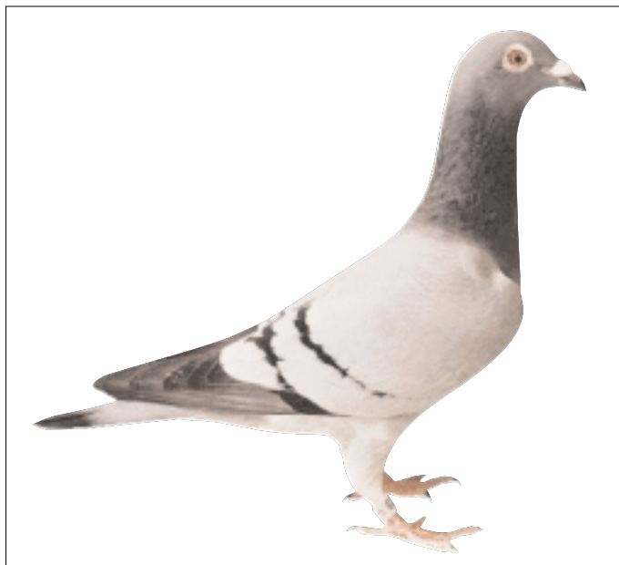
Sie errang 5-mal den ersten und 10-mal den zweiten Preis. Als Zuchttaube ist sie noch wertvoller: „Iron Lady“, ihr Name sagt alles.